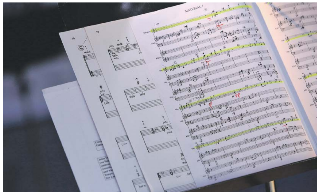
Ensemble Modern bei literaTurm

www.dresdenfrankfurt-dancecompany.com www.ensemble-modern.com www.lichter-filmfest.de www.literaturm.de www.momem.org www.museumsufercard.de www.nacht-der-museen.de www.open-books-frankfurt.de www.tanzplattform.de