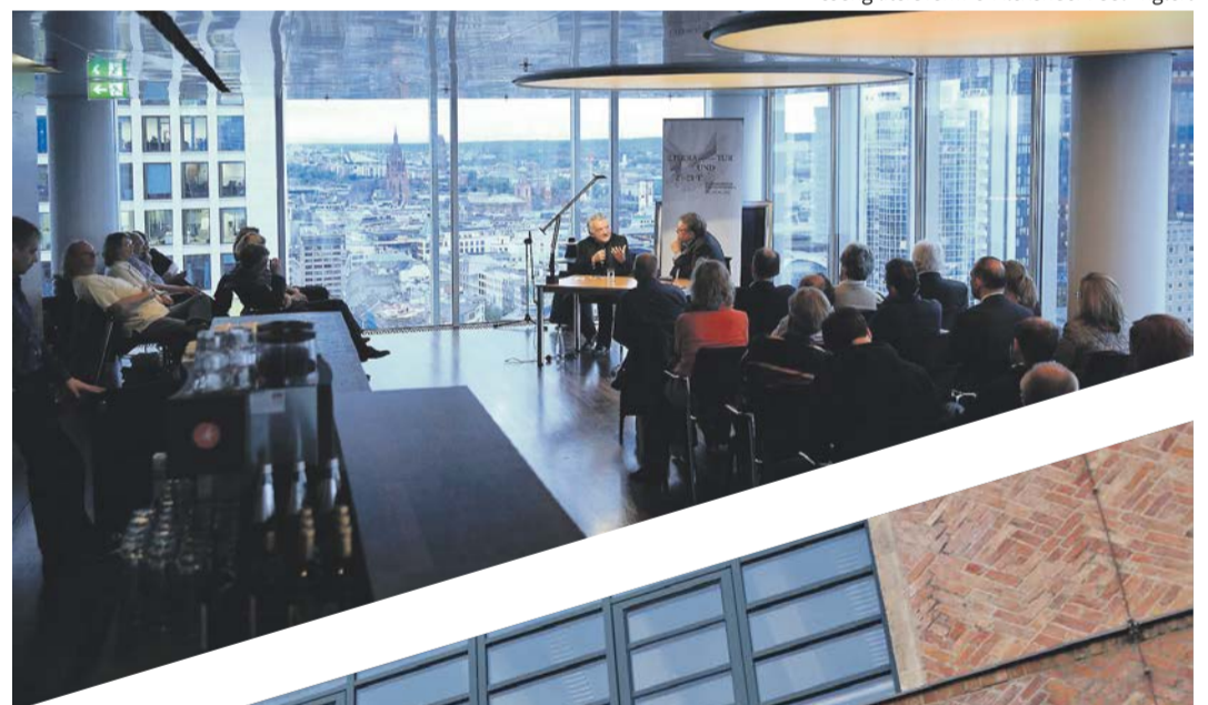
Lesung literaTurm